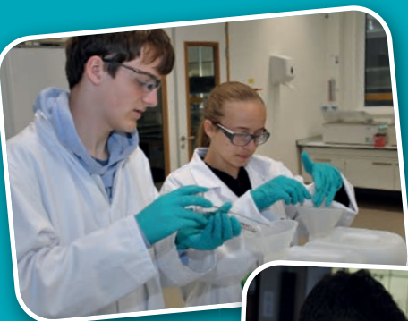
Practicum NSO Cosun 2018

Uit de winnaars wordt een team van vier leerlingen samengesteld dat Nederland vertegenwoordigt bij de Internationale Chemieolympiade