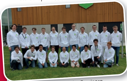
NSO 2019 Top 20 Avebe, Groningen